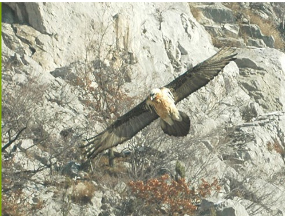
Le frisson de contempler les rapaces dans leur milieu naturel

Au plan international Mille Traces participe à la lutte anti braconnage des éléphants d'Afrique de l'Ouest.