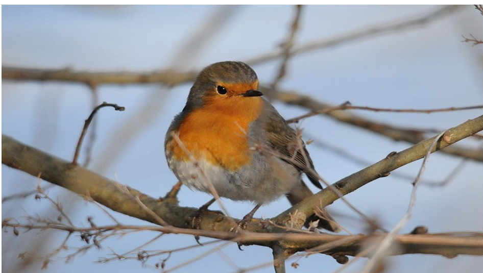
Rouge gorge qui attend nos mangeoires

Faites comme notre école, encouragez à la maison l'engagement de votre enfant: un balcon, un petit jardin suffisent pour devenir refuge LPO ou être vigie-nature.